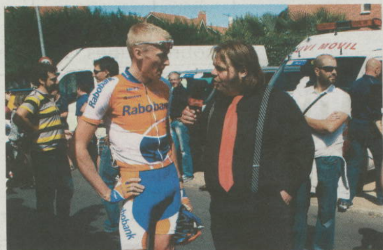
Gesink charla con un peculiar reportero de una televisión holandesa.