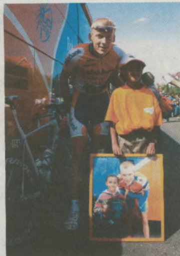
Un 'requetefan' de Gesmink.

Fue una mañana de domingo de fiesta. Fiesta del deporte y de la ciudadanía. No es muy habitual ver junto a la puerta de casa a figuras del deporte de renombre mundial. Pero el ciclismo y la Vuelta Ciclista a España lo permiten. En Rivas Vaciamadrid, La Vuelta hace escala cada año desde 2006. Bien es cierto que el año pasado, en 2008, fue un paso fugaz camino de Madrid. Pero en