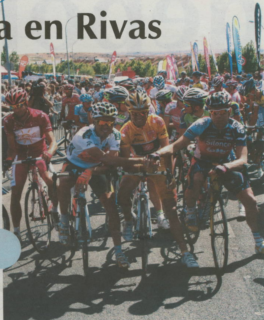
Los tres del podio, Samuel Sánchez, Alejandro Valverde y Cadel Evans, antes de salir.

La Vuelta eligió un año más Rivas Vaciamadrid para instalar el gran montaje de una línea de salida de etapa y el público respondió dando mucho calor y ánimo a los ciclistas en su último día de carrera