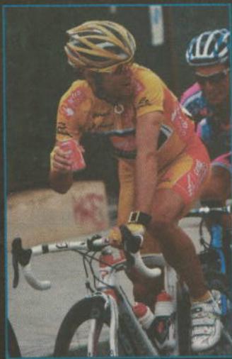
Madrid. El jersey de oro, bote de refresco en mano, seguía muy relajado antes de abandonar Rivas.

Tras un recorrido por Mejorada, Velilla, Arganda y Morata, el pelotón volvió a recorrer las calles de Rivas. Era, en plena hora de siesta, y a mayor velocidad. La 'serpiente multicolor' entró sobre las cuatro de la tarde al Casco Antiguo por la avenida de Francia y diez minutos después, y tras haber estrenado paso junto al recién inaugurado Auditorio Miguel Ríos, volvió a la carretera de Valencia camino de la Castellana de