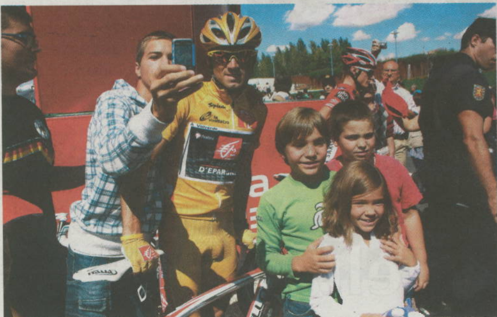
El jersey de oro, Alejandro Valverde, se prestó a fotografiarse con todos los jóvenes aficionados.